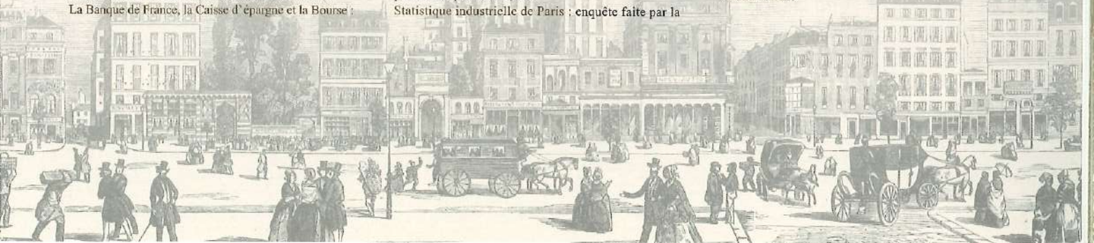
Table des gravures et des matières contenues dans le second volume

Les environs de Paris : château de Ville-d'Avray • Marnes et son château • manufacture de Sèvres • la château de Saint-Cloud • le château de Versailles • Trianon • Saint-Cyr • Meudon • Bellevue • eaux thermales et lac d'Enghien • Montmorency • Nanterre, etc.